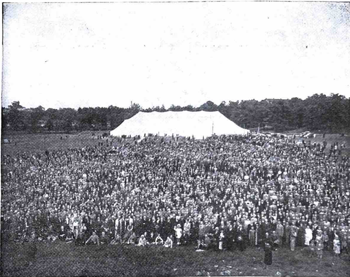
Sudjelci skupštine nedeljom prepodne kod Karlsberg sa šatorom u kojem je 10.000 osoba našlo mesta. — Istodobno bilo je i službe Božje u Filadelfijskoj zajednici i u još dva druga šatora; računalo se sudjelnike na 20.000.

iz 21 države Evrope, sastavljen je brzojav na Njeg. Vel. Kralja Gustava, na kojeg je Kralj dao odgovor, da želi konferenciji veliki Božji blagoslov. Kod Karlsberg-a gdje je ratna škola njeno vežbalište besplatno zajednici Filadelfiji stavila na raspolaganje, postavila je zajednica veliki šator za održavanje skupštine, koja je zahvatila 10.000 osoba, gdje se je narod svako veče za ovih dana konferencije skupljao, kao i još na dva druga mesta i svuda je bilo prepuno. Među govornicima koji su svako veče za to vreme govorili, bili su sledeća braća: Levi Pethrus iz Štokholma, H. Carter, Georg Jeffrey i Donald Gee iz Engleske, Pastor Barrat iz Norveške, Alfredo del Rosso iz Italije. To je bila osobita radost ove blagoslovene ljude Božje čuti. Zadnje nedelje bio je šator od više nego 15.000 osoba posećen. Kraljev rođeni brat, Prince Oskar Bernadotte sa ženom i kćerkom kao i ministar vanjskih poslova bili su isto prisutni. U svakoj skupštini obratilo se duša k Isusu. Haleluia!